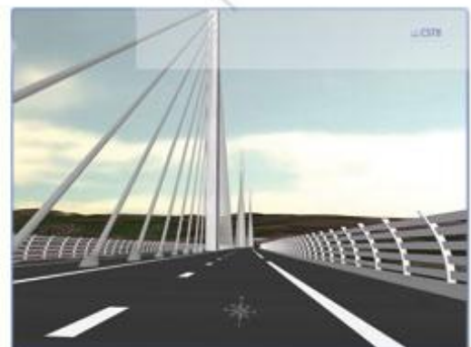
Evaluer la visibilité conducteur sur un projet (Eiffage, CSTB)