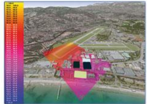
Étudier l'implantation générale du projet d'infrastructure dans son environnement (CSTB)