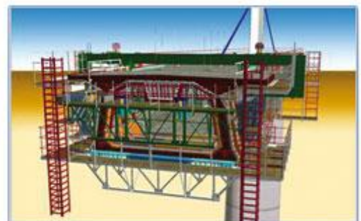
Étudier les méthodes de construction (Eiffage)