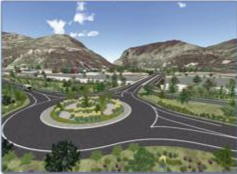
Communiquer avec un rendu réaliste virtuel des projets (Komenvoier)