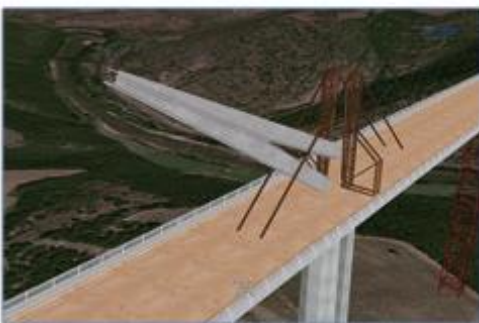
Suivi du phasage de construction (EIFFAGE, CSTB)

pour prolonger le projet COMMUNIC par de nouvelles recherches permettant de faire aboutir la démarche de développement du travail collaboratif dans les projets d'infrastructures.